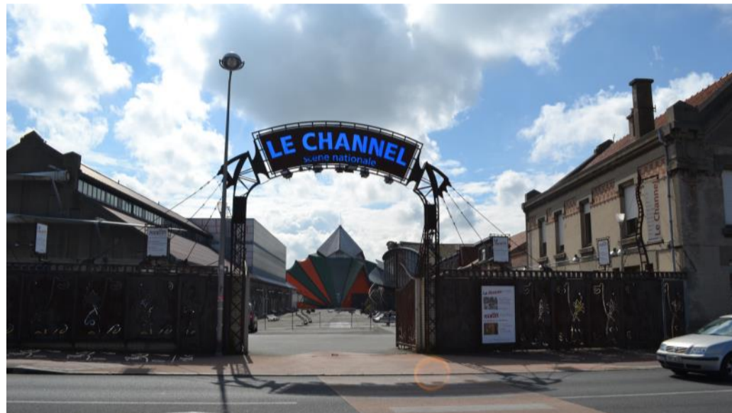
La prise de compétence culture n'est toujours pas à l'ordre du jour à l'agglomération.

Première délibération, celle concernant la nouvelle répartition des sièges au conseil d'agglomération. L'arrivée des communes de Frethun, Hames-Boucres, Les Attaques, Nielles-les-Calais, amène une redistribution des sièges. Ainsi Calais conservera ses 26 sièges, les autres se répartissant comme suit : Coquelles 2, Coulogne 5, Frethun 1, Hames-Boucres 1, Les Attaques 2, Marck 10, Nielles-les-Calais 1, Sangatte 4. L'arrivée éventuelle de Escalles se faisant par l'attribution d'un siège pour Escalles et un