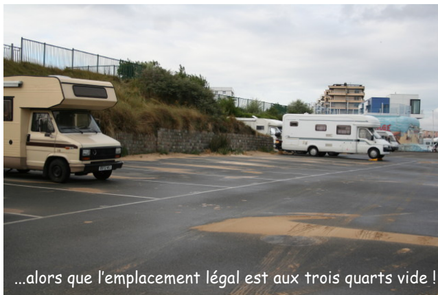
...alors que l'emplacement légal est aux trois quarts vide !

Que chacun assume ses décisions ! Mais est-ce dans les gênes de Mme Bouchart ?