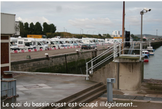
Le quai du bassin ouest est occupé illégalement...

Mme le Maire, comme à l'accoutumée, n'hésite pas à déclarer que l'ancienne municipalité aurait dépensé toute la capacité budgétaire de la ville de Calais, que les réserves financières seraient épuisées... !